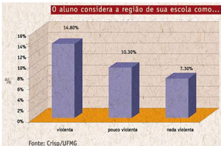
Imagem 2 – Porcentagem de alunos que acham o ambiente escolar violento